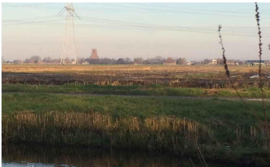
Cora's uitzicht, zonder mais

Toen ik me 25 jaar geleden ging nestelen in een tuin/huisje aan de Kerkelandersloot, moest ik om van het weidse uitzicht te kunnen genieten eerst een muur van een 2 meter hoge, 10 meter lange coniferenhaag ruimen. Achter de coniferen kwam een echt waterlands weiland tevoorschijn compleet met bonte koeien en hun kalfjes; paarden met veulens, schapen met lammetjes en niet te vergeten de weidevogels, waaronder de nu met uitsterven bedreigde grutto. Dit alles met op de achtergrond de door Rembrandt vereeuwigde toren van Ransdorp. Helaas wordt al een paar jaar zomers het vergezicht me ontnomen door saai mais.