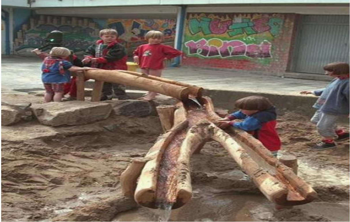
Voorbeeld van een waterbaan